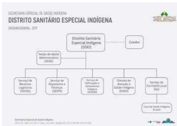
FIGURA 02. ORGANOGRAMA DO DSEI